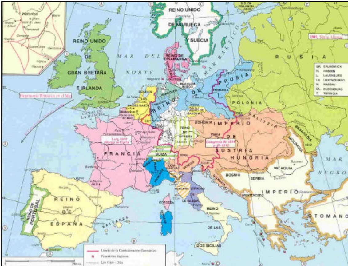
13. Europa tras el Congreso de Viena de 1815.