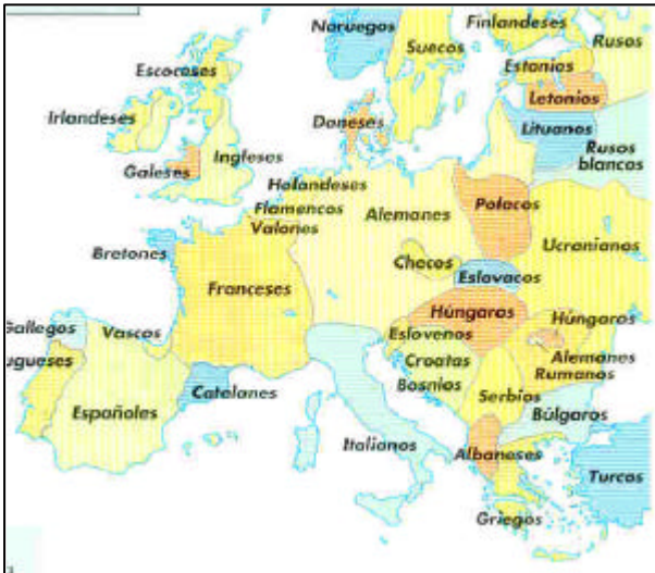
14. Lenguas y naciones (no estados) en Europa.

El liberalismo es una doctrina básica e irrenunciable de la mentalidad burguesa, se basa en la libertad absoluta del individuo para expresar sus ideas, reunirse, conservar sus propiedades... sin que ningún poder pudiera acabar con ellas. En lo político el liberalismo recibe el nombre de liberalismo político y es una síntesis de las ideas de los ilustrados: división de poderes, parlamentos elegidos por la nación como poder legislativo, sufragio censitario, monarquía parlamentaria o república como forma de gobierno... En el aspecto productivo el liberalismo recibe el nombre de liberalismo económico que resume el pensamiento de los ilustrados basado en que el estado no debe intervenir en