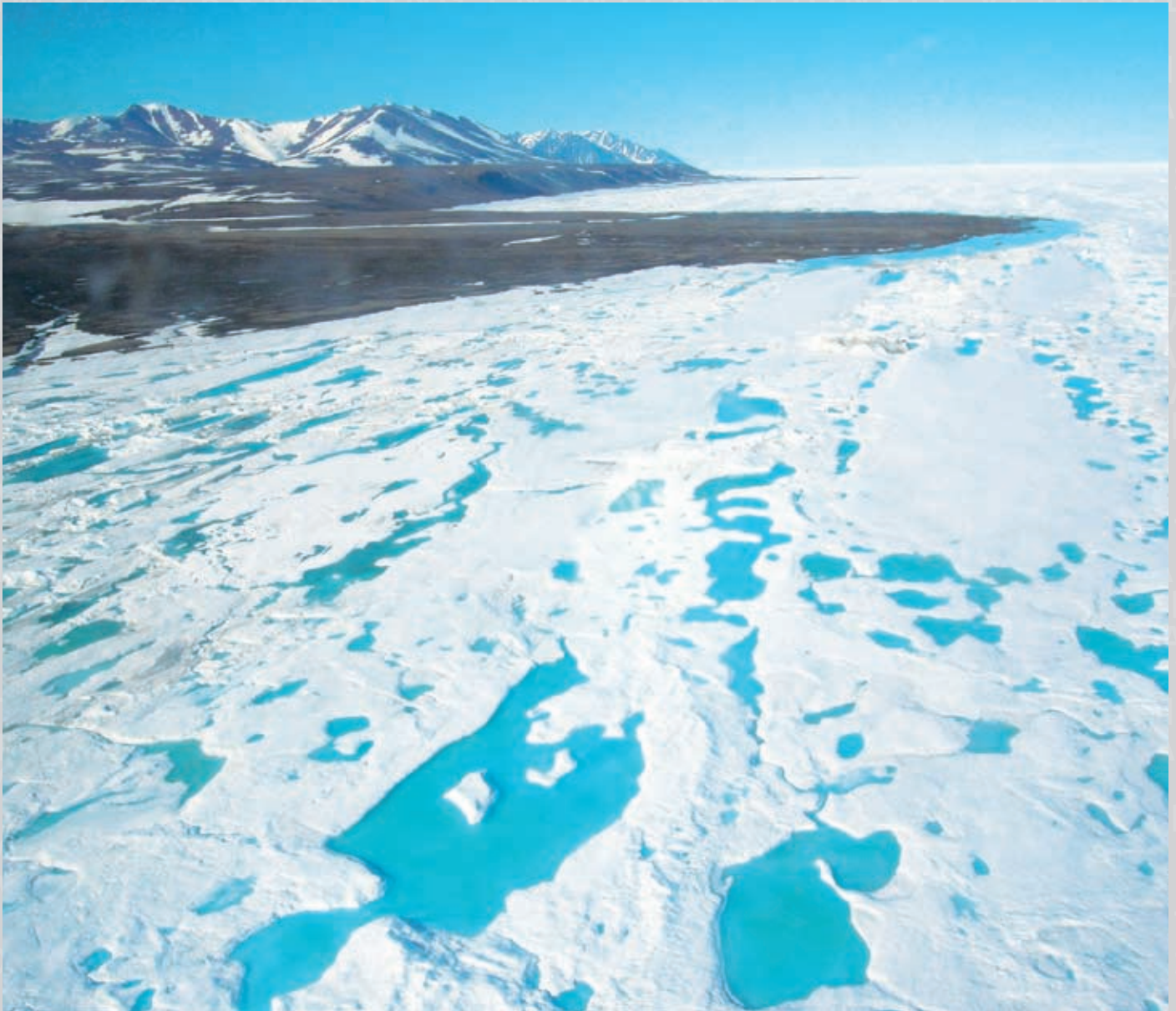
Cape Morris Jesup, Greenland

El rápido deshielo de los casquetes glaciares polares, en especial del Ártico, está abriendo nuevos canales y rutas comerciales internacionales. Además, la accesibilidad creciente a los enormes recursos de hidrocarburos en la región ártica está cambiando la dinámica geoestratégica de la región con consecuencias potenciales para la estabilidad internacional y los intereses de seguridad europeos. Un ejemplo de los nuevos intereses estratégicos resultantes es el reciente izamiento de la bandera rusa en el polo norte. Hay una necesidad creciente de abordar el debate sobre las nuevas demandas territoriales y el acceso a nuevas rutas comerciales por parte de distintos países que desafían la capacidad de Europa para garantizar efectivamente en la región sus intereses comerciales y sobre los recursos, y pueden ejercer presión en sus relaciones con socios clave.