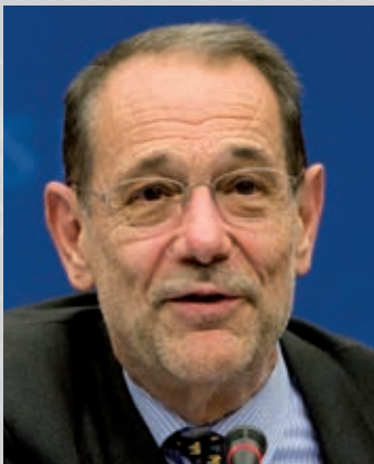
* D. Javier SOLANA MADARIAGA, Secretario General del Consejo de la Unión Europea y Alto Representante de la UE para a Política Exterior y de Seguridad Común.

Los riesgos que plantea el cambio climático son reales y su incidencia ya se está haciendo sentir. Las Naciones Unidas estiman que todos sus llamamientos urgentes de ayuda humanitaria de 2007 excepto uno, tenían relación con el cambio climático. En 2007, el Consejo de Seguridad de las Naciones Unidas mantuvo su primer debate sobre el cambio climático y sus consecuencias para la seguridad internacional. El Consejo Europeo ha llamado la atención sobre la incidencia del cambio climático en la seguridad internacional y, en junio de 2007, instó al Alto Representante y a la Comisión Europea a presentar en la primavera de 2008 un informe común al Consejo Europeo.